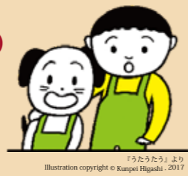
「うたうたう」より Illustration copyright © Kunpei Higashi / 2017

〒176-0021 東京都練馬区貫井4-1-11 TEL:03-3577-8965 FAX:03-3825-9187 http://www.kosaidoakatsuki.jp